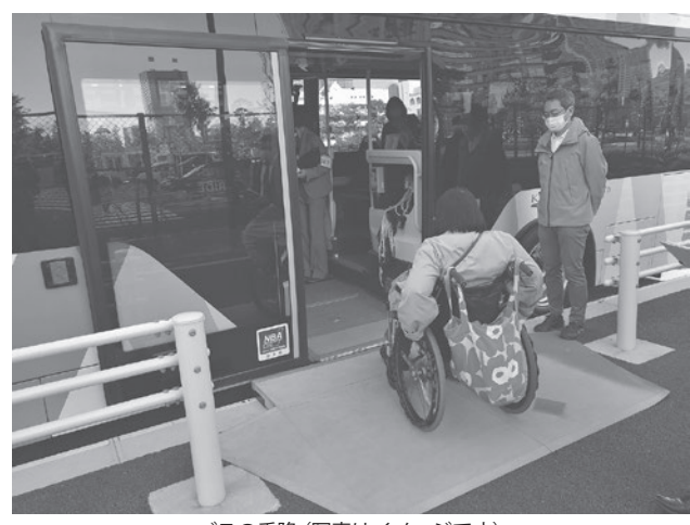
バスの乗降(写真はイメージです)

資料として公開されていますので、ご参照ください。 ▼移動等円滑化評価会議のサイト(国土交通省) https://www.mit.go.jp/sogosesaku/barrierfree/sosei_barrierfree_tk_000160.html